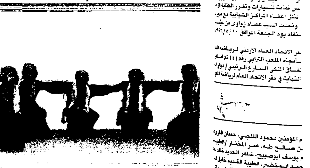
جانب من العرض الفني للمدرسة

الارني، حيث جسده اعضاء الفرقة المني الحقيقي للمهرجانات العربية في جمهورية مصر من خلال تقديم افضل الالمانية الرومات المعروفة على آلة العود بالاضافة الى تقديم فقرات السبحة والجوجية، هذا وثلاث القرحة اعجاب الحضور، حيث اشاد وزير الثقافة بجاه الفرقة الالمانية وتكذلك القبول المصري في عمان الذي وعد بدعوة الارني، حيث جسده اعضاء الفرقة المني الحقيقي للمهرجانات العربية في جمهورية مصر من خلال تقديم افضل الالمانية الرومات المعروفة على آلة العود بالاضافة الى تقديم فقرات السبحة والجوجية، هذا وثلاث القرحة اعجاب الحضور، حيث اشاد وزير الثقافة بجاه الفرقة الالمانية وتكذلك القبول المصري في عمان الذي وعد بدعوة